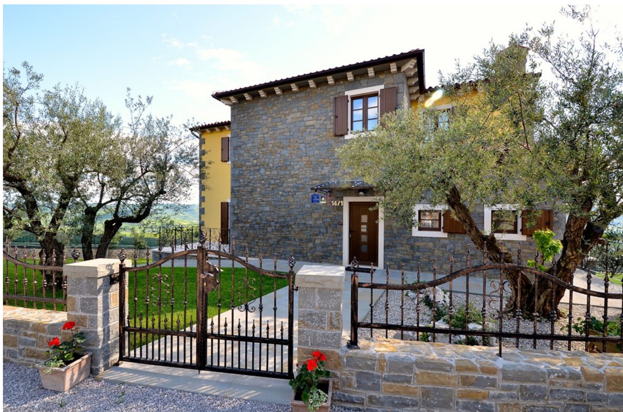
Aktivan odmor - Villa Maslina

13.04.2019 18:01 | Autor: Gordana ČALIĆ ŠVERKO