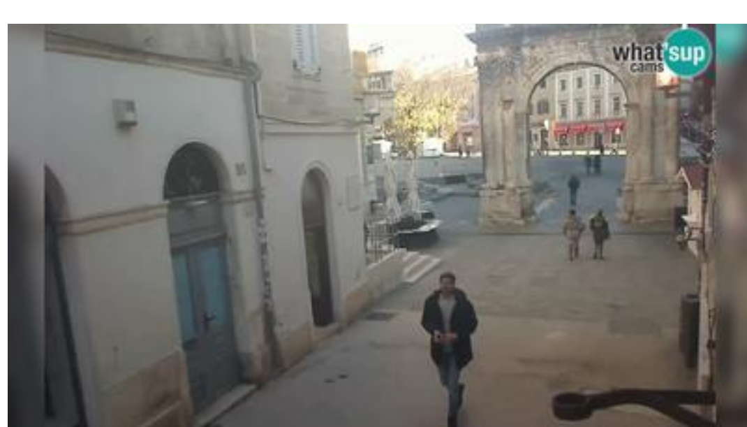
Pula: Golden Gate of